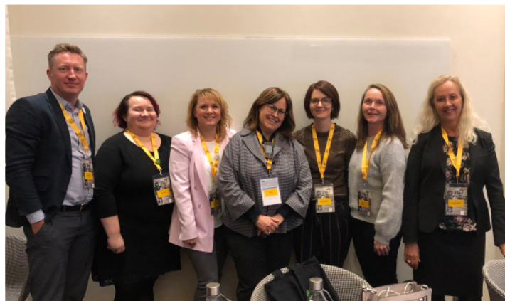
LapCI ry:n ja pohjoismaisten sisarusjärjestöjen edustajat

Erityisen ilahduttavaa teknologian kehityksessä on se, että kuulotutkimuksen voi tehdä oikeastaan ihan missä tahansa. Esimerkiksi kehitysmaissa ei ole ollut sähköä, kuulokeskusta