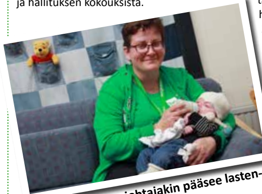
Joskus toiminnanjohtajakin pääsee lastenhoitopuuhiin!